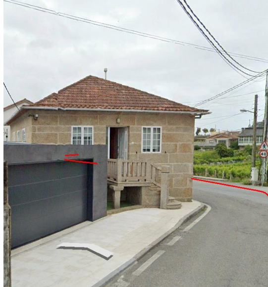
LUGAR A BOUZA N° 89 – CASTRELO (Punto quilométrico 0+250)

SEGUNDO.- Segundo o escrito que se achega coa reclamación “EL SINIESTRO TIENE SU OCURRENCIA A CAUSA DEL ATASCO DE UNA ARQUETA DE LA RED GENERAL DE SANEAMIENTO DEL AYUNTAMIENTO, LOCALIZADA EN EXTERIOR DE LA VIVIENDA ASEGURADA EN PÓLIZA”.